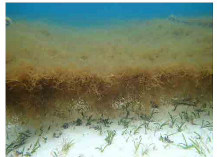
写真：岩手県広田湾におけるワカメ養殖（左）、長崎県新上五島町の天然海藻群落（中） 沖縄県本部町のオキナワモズク養殖（右）